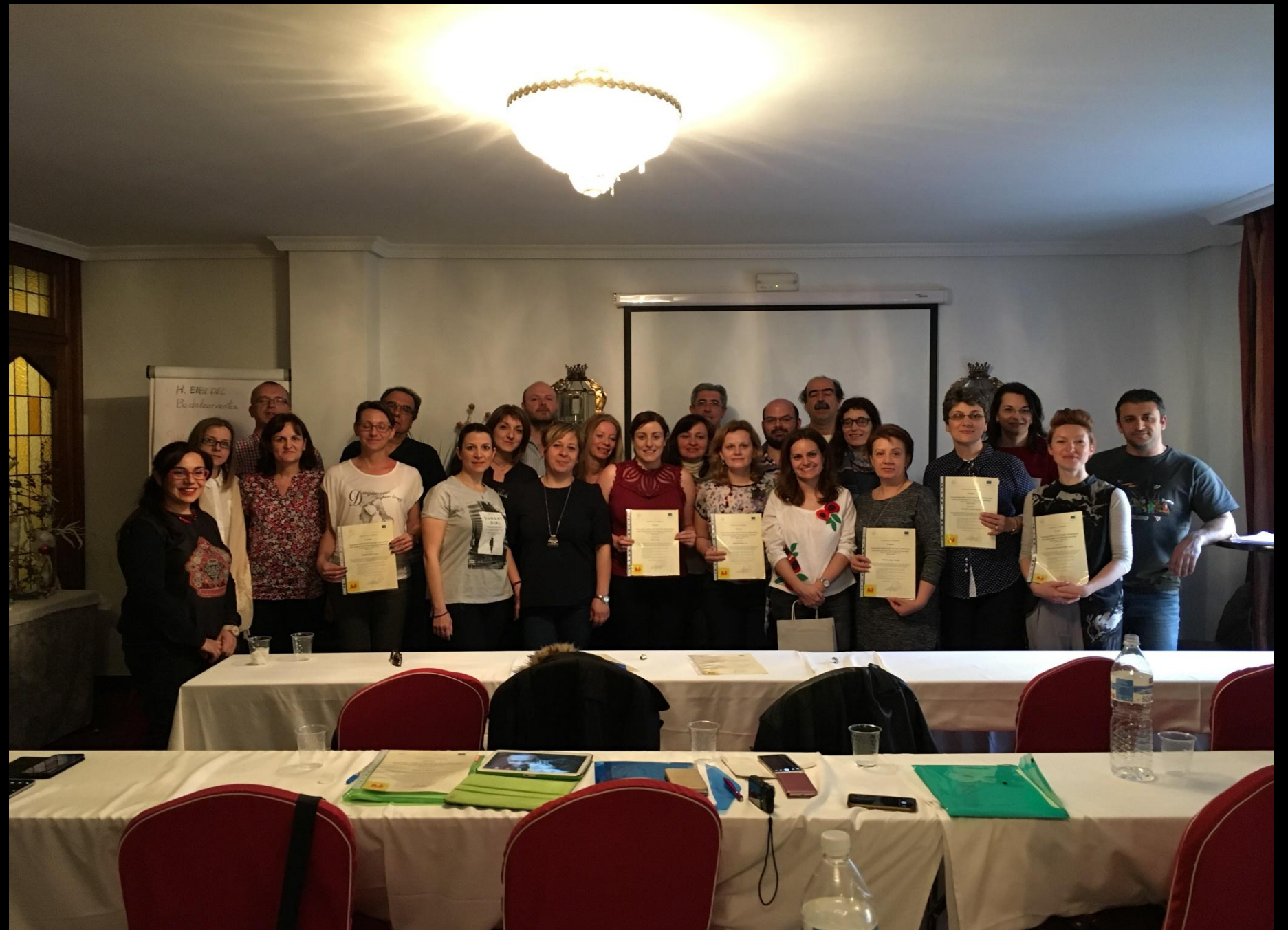
Fotografie de grup, la final